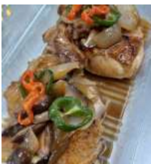
鶏もも肉のバター醤油グリル