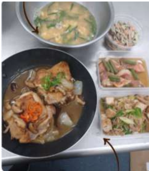
厚揚げと豚肉のすき煮、赤魚の煮つけ