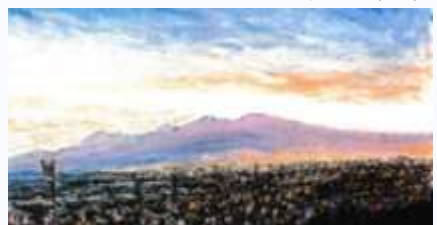
また、賢くなりやした！ I.R (C)