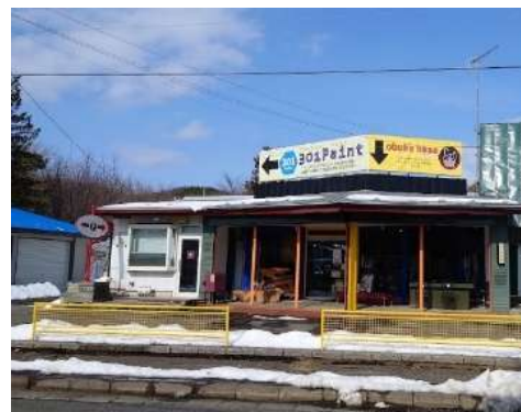
obuke base (おおぶけ ベース)