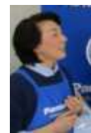
(有) 柿沢電器 上田3丁目5-25 電話 622-0593

→ 上蓋を開けて溜まっている毛玉くずを掃除。 ストロングネットの蓋を外して毛玉くずを掃除。