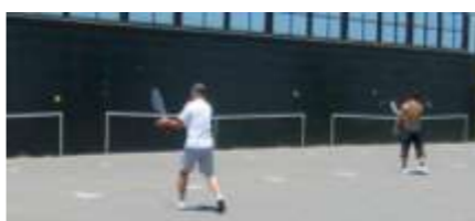
壁打ちテニス 信州スカイパークサービスセンター https://shinshu-skypark.net/を参考にしました。

「壁ドン」ではありません。「壁」を相手に黙々と練習することです。「壁」を相手にひたすらボールを打ち返す。テニスなどの球技で行なわれます。そこから派生して、独り言をつぶやき続ける行為となりました。たとえばX(旧ツイッター)上で淡々と自説を述べること指します。 最近では、AIに対して「壁打ち」をする、AIが膨らむと言われています。AIが膨らむと言われている「壁打ち」とは、自分のアイデアについて「壁」役の相手から意見をもらうこと。自分の思考を整理したり、新たな視点を得たりする手法です。昔流行った「ブレインストーミング(ブレイン)」に似ているかもしれません。 「壁打ち」においては、聞き役となる相手「壁」が疑問を聞いてくれる人かどうかが、自分が共感できる人かどうかが重要となると思われまます。 ところで「壁打ち」のキモは、一人て出来る練習である点です。「壁打ち」の目的は、「もっと上手になりたい」という気持ちか。「一人でやるのは今の自分のレベルが恥ずかしいから。しかし恥ずかしくてはいけません。自分の今のレベルを自覚することです。さてさて「壁打ち」をしていて、分かる事があります。 一生続けていくのが楽しいかどうか？ 自分に向いているかどうか？ そうなのです。 「壁打ち」は、自分の天職かどうかを探る手段になるのです。