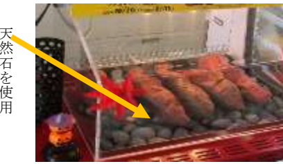
天然石を使用 まだまだ寒いですが、 美味しい「焼き芋」で 温まってください

一月某日 晴れ! 新年が始動しました。 今年はどうな年にしたいですか? 今の時代、若い方も先輩の方も、みなさ ん、美容に気を遣っています。確かに、若い い方は、お客様の中にたくさんいらつしや います。 巷には美容グッズが溢れていますし、皆さ ん、それぞれの秘訣を身に付けられているよ うです。店にも人気の化粧品があります。 話は変わって、今どきお客様に重宝がら れる品があります。「激熱カイロ」もその一つで す。熱めでよいそうですよ。 本年も張り切っていきましょう。