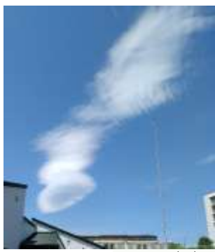
I. R (C)