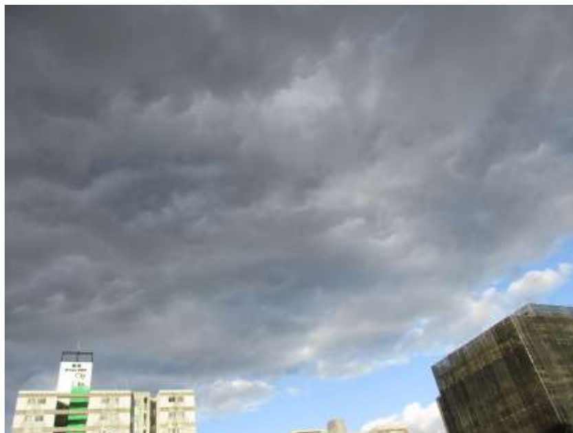
雷雲か？ 昨年の秋に、盛岡市内で出会った雲。嵐になる予感がしました。