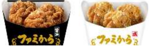
<人気の定番> ファミから(醤油)、ファミから(塩)